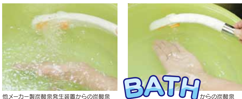
他メーカー製炭酸泉発生装置からの炭酸泉からの炭酸泉

※上記は、同じ濃度の炭酸泉を生成したときの写真で、左が従来品で、炭酸ガス使用圧力は0.3Mpa、右はBATHで0.06Mpaで充分。BATHのほうが、気泡が発生せず水に炭酸ガスが効率的に溶け込んでいるのがわかりますので炭酸ガスが無駄になりません。