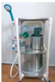
専用キャビネット設置例